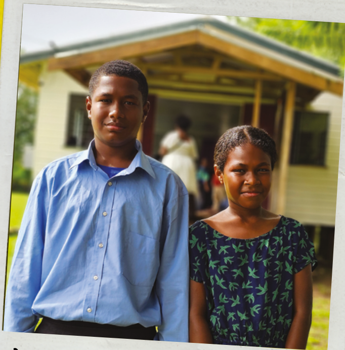
Vilikesa e Neomai