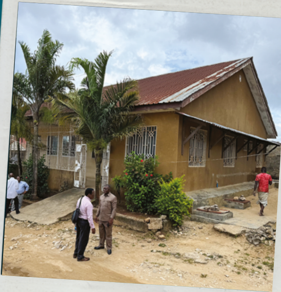
Clinica – Edifício Principal